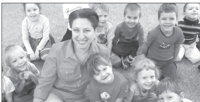
«БУДЬТЕ КАК ДЕТИ...»