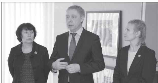
«СЕМЬ ШАГОВ К ПРОФЕССИИ»