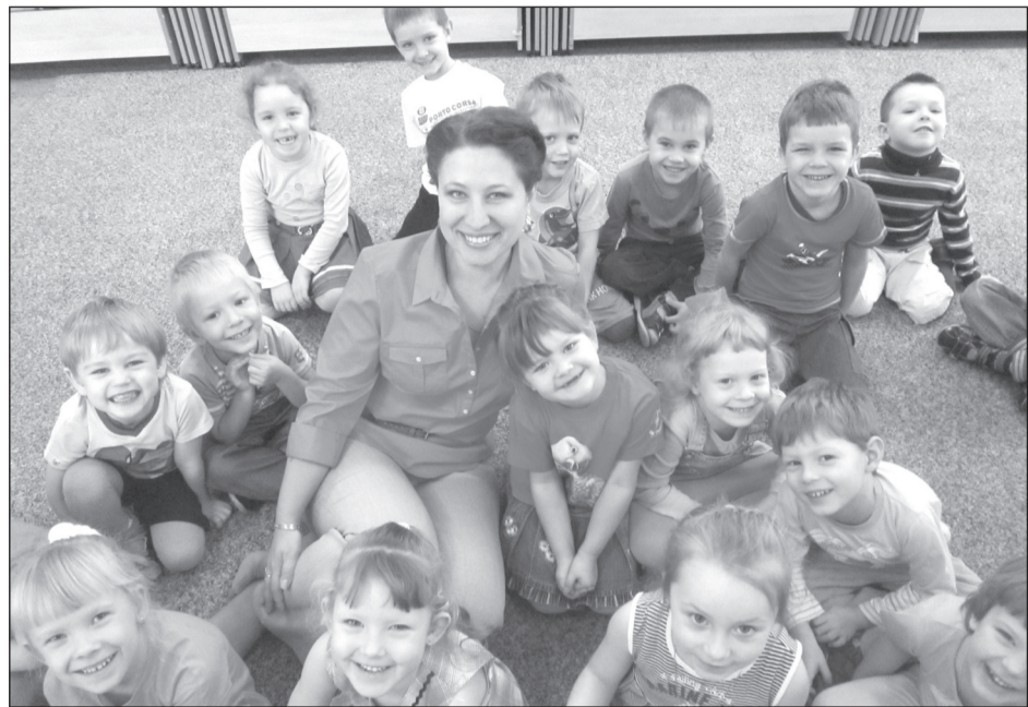
ФОТО ИЗ АРХИВА Е. МАНАСЯН

- Не скрою, само участие в подобных проектах - это сложно и физически, и эмоционально. Но оно того стоит. Новые люди, новые впечатления, возможность многое переосмыслить, в первую очередь, в отношении себя. Так сложилось, что городской этап конкурса по срокам совпал с моими государственными экзаменами в филиале МГПУ, а областной тур проходил вскоре после защиты диплома.